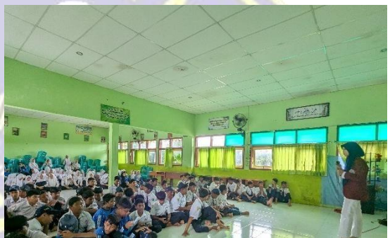
Hari ke dua penayangan video