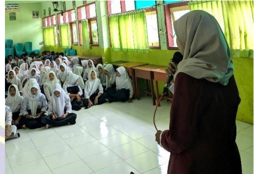
Hari pertama penayangan video