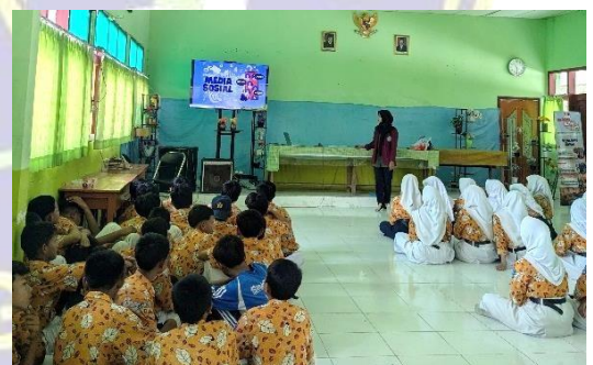
Hari ke tiga penayangan video