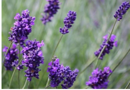
Gambar 2. 1 Bunga Lavender