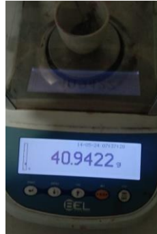
Hasil kadar abu tidak larut asam Replikasi II