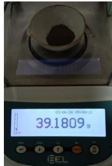
Hasil kadar air Replikasi II