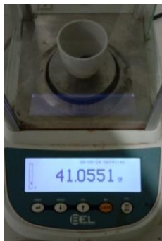
Hasil kadar abu total Replikasi II