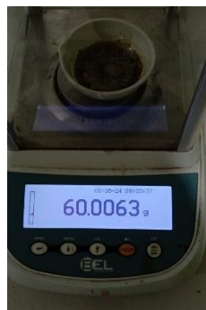
Hasil kadar sari larut etanol Replikasi II