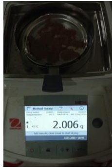
Penimbangan Replikasi II