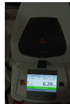
Hasil susut pengeringan Replikasi III