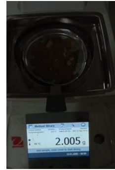
Penimbangan Replikasi III