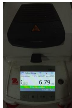
Hasil susut pengeringan Replikasi II