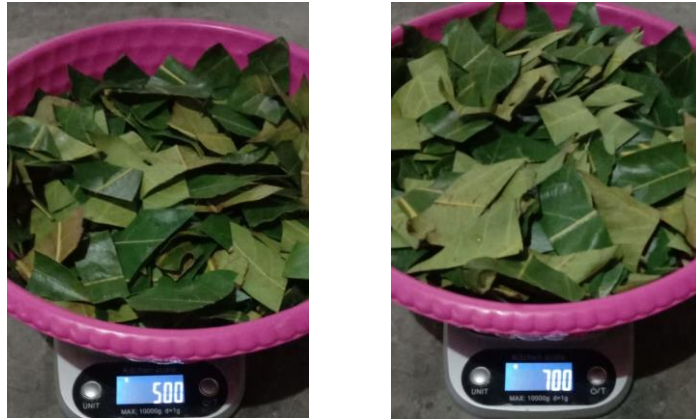
Daun sukun sebelum dikeringkan