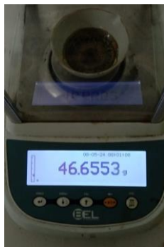
Hasil kadar sari larut etanol Replikasi I