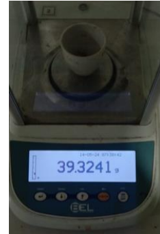
Hasil kadar abu tidak larut asam Replikasi III