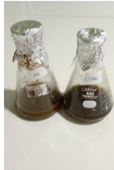
Pencampuran dan pengendapan simplisia