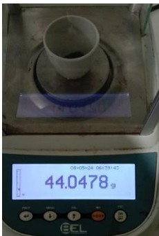
Hasil kadar abu total Replikasi I