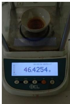
Hasil kadar sari larut air Replikasi I