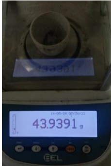
Hasil kadar abu tidak larut asam Replikasi I