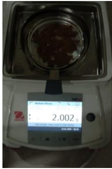
Penimbangan Replikasi I