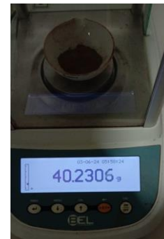
Hasil kadar air Replikasi III