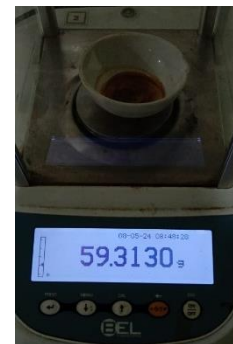
Hasil kadar sari larut air Replikasi III