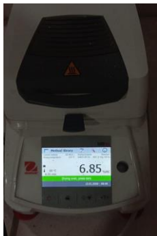
Hasil susut pengeringan Replikasi I