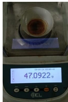
Hasil kadar sari larut air Replikasi II