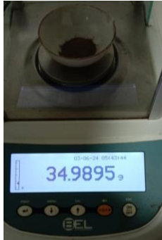
Hasil kadar air Replikasi I