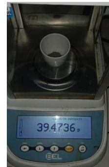
Hasil kadar abu total Replikasi III