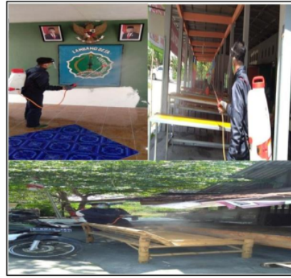
Gambar 6. Penyemprotan disinfektan di tempat umum Desa Plosowahyu