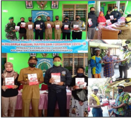
Gambar 5. Pembagian paket PHBS kepada masyarakat desa Plosowahyu