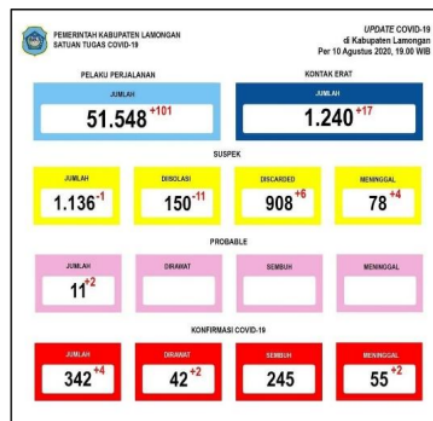
Gambar 2. Update COVID-19 di Kabupaten Lamongan per 10 Agustus 2020

Desa Plosowahyu merupakan salah satu desa di Kecamatan Lamongan. Desa Plosowahyu juga termasuk salah satu desa yang warganya terindikasi positif COVID-19 yakni terdapat empat orang pasien positif COVID-19. Kurangnya kepedulian masyarakat terhadap himbauan pemerintah menjadi salah satu penyebab naiknya angka pasien positif COVID-19 di Kabupaten Lamongan. Hal ini dibuktikan dengan banyaknya masyarakat yang tidak mematuhi protokol kesehatan seperti tidak memakai masker saat keluar rumah, tidak menjaga jarak dan tidak menerapkan perilaku hidup bersih dan sehat. Perlu adanya tindakan pencegahan COVID-19 di Desa Plosowahyu dengan cara mendisiplinkan warganya untuk selalu mentaati