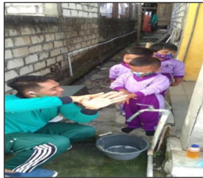
Gambar 4. Praktik enam langkah cuci tangan pakai sabun yang benar oleh fasilitator sebagai pendamping.