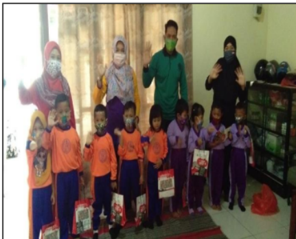
Gambar 3. Sosialisasi COVID-19 dan Edukasi PHBS kepada anak-anak Yayasan PAUD Melati dan Yayasan TK Surya Baru

Tahapan setelah pelaksanaan sosialisasi adalah tahapan praktek cara mencuci tangan yang benar (Gambar 4). Hal ini membuat anak-anak dan masyarakat terlibat secara langsung dalam praktek mencuci tangan dengan sabun. Tahapan ini dipandu dan didampingi oleh fasilitator agar penerapan pengetahuan mengenai perilaku hidup bersih dan sehat dengan cuci tangan dengan sabun dapat dipraktekkan dengan benar sehingga dapat mengurangi risiko terpaparnya COVID-19.