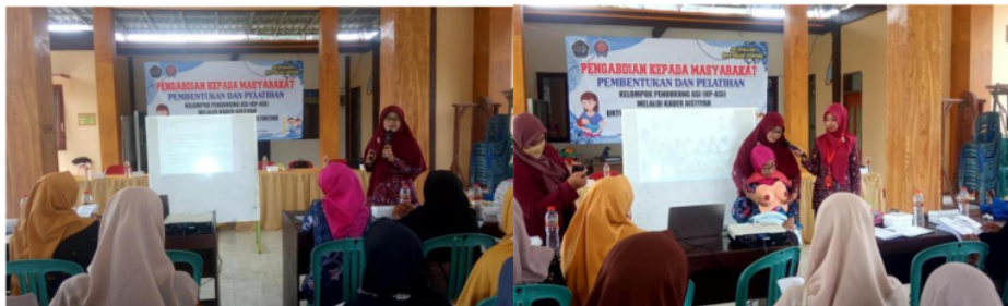
Gambar 2. Penyampaian materi tentang manajemen menyusui

Pelatihan kelompok pendukung ASI (KP-ASI) dilakukan dengan metode ceramah, tanya jawab, curah pendapat, diskusi, demonstrasi, role play , praktik lapangan, presentasi dengan power point. Awal sebelum pemaparan materi, ibu-ibu kader diberikan lembar kuesioner untuk dilakukan pre-test . Setelah selesai pre-test , dilanjutkan edukasi oleh pemateri metode ceramah, tanya jawab, curah pendapat, diskusi tentang zat gizi dalam ASI, manfaat ASI, posisi menyusui, teknik menyusui, lama menyusui, dan masalah dalam menyusui. Demonstrasi perawat 6 payudara dengan mengajak kader ikut serta menjadi probandus, seperti terlihat pada Gambar 2 dan Gambar 3.