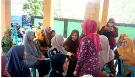
Gambar 4. Tanya jawab tentang manajemen menyusui