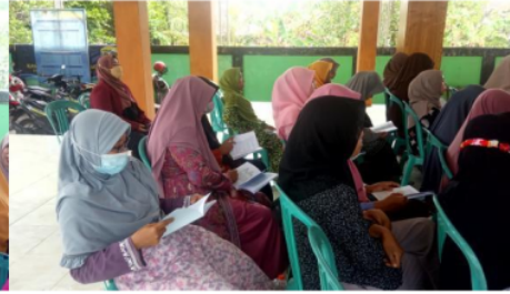
Gambar 5. Pemberian modul menyusui

Penutupan acara diakhiri dengan doa dan foto bersama yang dihadiri oleh kepala desa, perangkat desa, bidan desa, serta ibu-ibu kader. Mekanisme evaluasi keberhasilan program diukur dari pemaparan hasil diskusi interaktif terkait pembahasan tentang masalah menyusui, melakukan pengisian post-test yang dilakukan pada minggu ke 4 setelah pemberian edukasi, seperti terlihat pada Tabel 1.