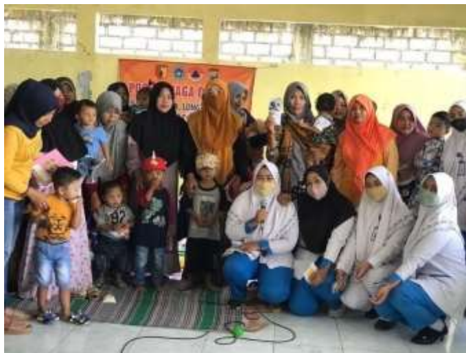
Gambar 5.3. Pengisian kuesioner post-test dan foto bersama

Monitoring dan evaluasi pelaksanaan program dilakukan guna Memanta. Keberhasilan program yang telah dilakukan. Pemantauan dilakukan setiap satu bulan melalui observasi Ke rumah Mitra ( door to door )