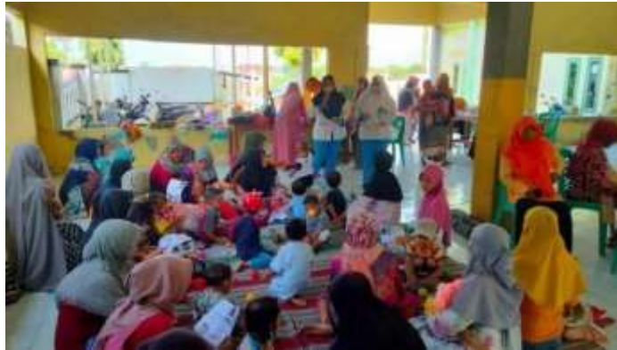
Gambar 5.2. Antusias peserta saat diberikan edukasi pengetahuan tentang Pencegahan Stunting pada Anak