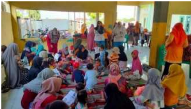
Gambar 5.1. Pengisian kuesioner pre-test