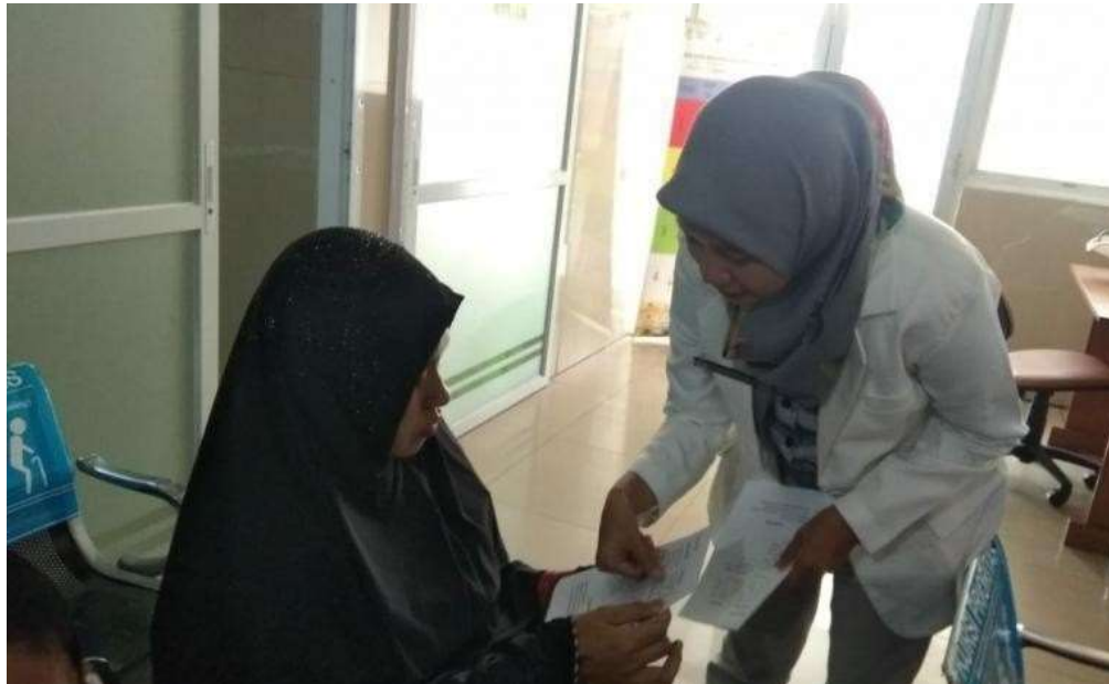
Gambar 5.2. Pengisian kuesioner post-test setelah edukasi pengetahuan tentang Inisiasi Menyusu Dini

Monitoring dan evaluasi pelaksanaan program dilakukan guna memantau keberhasilan program yang telah dilakukan. Pemantauan dilakukan dengan cara mempraktekkan bagaimana Inisiasi Menyusu Dini.