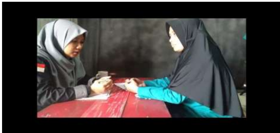
Gambar 5.1. Pengisian kuesioner pre-test